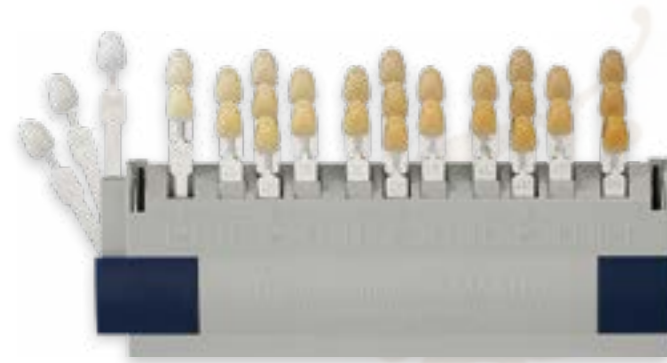
VITA Toothguide 3D-Master farveskala med bleach skala

Med VITA Toothguide 3D-Master farveskalaen, kan man finde alle naturlige tandfarver præcist og systematisk.