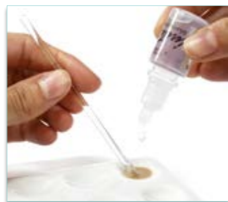
Diluting Liquid (fortynder væske) 876449