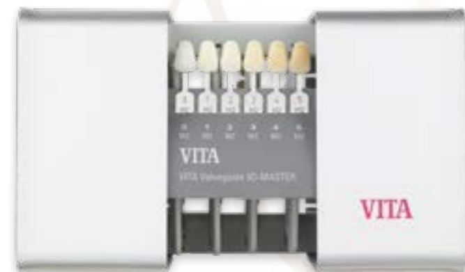
VITA Linear guide 3D Master

Med VITA Linear guide 3D-Master kan du bestemme korrekt tandfarve hurtigt og præcist.