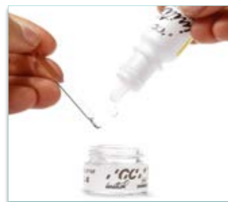
Refresh Liquid (opfrsker væske) 876450