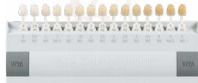
VITA Bleach guide 3D Master

Med VITA Bleach guide 3D-Master farveskalaen, kan man finde alle naturlige tandfarver præcist og systematisk. Bleach skalaen giver dig mulighed for at finde farven på blegede tænder. Lige så enkelt og præcist som med resten af 3D-Master skalaen.