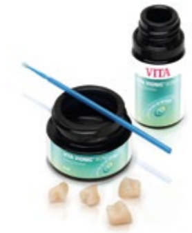
VITA VIONIC bond VA8179